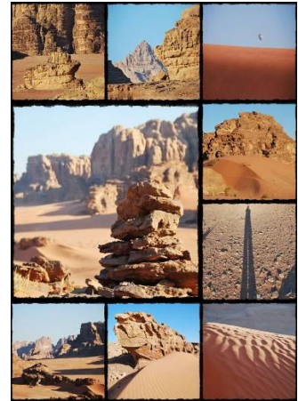
มา การ ขาน เสียง

กลางวัน 🕒 รับประทานอาหารกลางวันบาบิโลน บนเรือ พร้อมชมทัศนียภาพ และบรรยากาศของทะเลแดง บ่าย นำท่านเดินทางสู่ ทะเลทรายวาดีรัม (WADI RUM) ทะเลทรายแห่งนี้ในอดีตเป็นเส้นทางคาราวานจากประเทศ ซาอุดีอาระเบีย เดินทางไปยังประเทศซีเรียและปาเลสไตน์ (เคยเป็นที่อยู่อาศัยของชาวนาบาเทียนก่อนที่จะย้ายถิ่นฐานไป สร้างอาณาจักรอันยิ่งใหญ่ที่เมืองเพตรา) ในศึกสงครามอาหรับรีโวลท์ระหว่างปี ค.ศ. 1916–1918 ทะเลทราย แห่งนี้ได้ถูกใช้ในฐานะบัญชาการในการรบของนายทหารชาวอังกฤษ ทีอี ลอว์เรนซ์ และ เจ้าชายไฟซาล ผู้นำแห่ง ชาออาหรับร่วมรบกันขับไล่พวกออตโตมันที่เข้ารุกรานเพื่อครอบครองดินแดน และต่อมายังได้ถูกใช้เป็น สถานที่จริงในถ่ายทำภาพยนตร์ฮอลลีวูดอันยิ่งใหญ่ในอดีตเรื่อง “LAWRENCE OF ARABIA” นำท่านนั่งรถกระบะเปิดหลังมารับบรรยากาศท้องทะเลทรายที่ถูกกล่าวหาว่าสวยงามที่สุดแห่งหนึ่งของโลก ด้วยเม็ดทรายละเอียดสีส้มอมแดงอันสงบที่กว้างใหญ่ไพศาล (สีของเม็ดทรายนั้นปรับเปลี่ยนไปตามแสงของ ดวงอาทิตย์) นำท่านท่องเที่ยวทะเลทรายต่อไปยังภูเขาคาซารี ชมภาพเขียนแกะสลักก่อน ประวัติศาสตร์ ที่เป็นภาพแกะสลักของชาวนาบาเทียนที่แสดงถึงเรื่องราวในชีวิตประจำวันต่างๆ และรูปภาพต่าง ๆ ผ่านชมเดินที่ชาวเบดูอินที่อาศัยอยู่ในทะเลทราย เลี้ยงแพะเป็นอาชีพ ฯลฯ (เป็นธรรมเนียมปฏิบัติในการให้ทิปท่านละ 2 USD แก่คนขับรถ) ค่ำ 🕒 รับประทานอาหารมื้อค่ำกลางทะเลทรายในแคมป์ของชาวเบดูอิน ☞ นำท่านเข้าที่พัก นอนดูดาว กลางทะเลทรายวาดีรัม RAHAYED CAMP หรือ เทียบเท่า