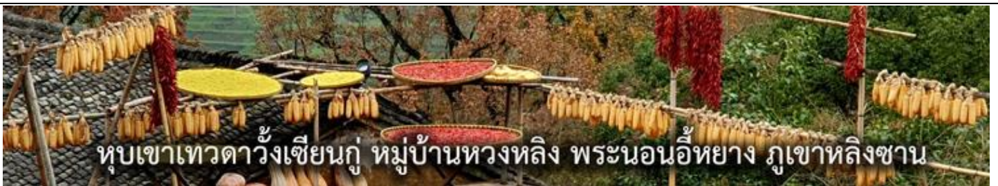
หุบเขาเทวดาวังเซียนกู่ หมู่บ้านหวงหลิง พระนอนอ๋อหยาง ภูเขาหลิงซาน

(CSX659-SL) : หุบเขาเทวดาวังเซียนกู่ หมู่บ้านโบราณหวงหลิง ล่องเรือชมแสงสีอุ๊วนี่โจว หมู่บ้านจำลองลูเชิร์น เมืองจิ้งเต๋อเจิ้น ภูเขาหลิงซาน พระนอนอ๋อหยาง (พักในหุบเขาเทวดา)